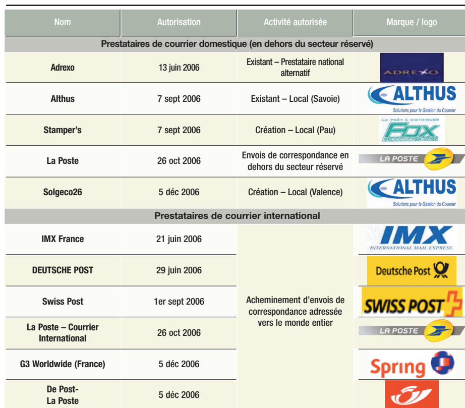
TABLEAU RECAPITULATIF DES 10 OPÉRATEURS AUTORISÉS

la délivrance des premières autorisations a suscité l'intérêt de nombreux nouveaux opérateurs. Ces expériences conduisent l'Autorité à penser qu'elle pourrait recevoir prochainement un nombre croissant de demandes d'autorisations sur le marché de la distribution domestique, ouvert plus récemment à la concurrence.