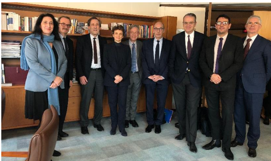
Les présidents des neuf autorités réunis dans les locaux de l'Autorité des marchés financiers

Les autorités participantes sont l'AMF, l'Autorité de la Concurrence, l'Arcep, l'ARJEL, l'ART, la CNIL, la CRE, le CSA et la HADOPI.