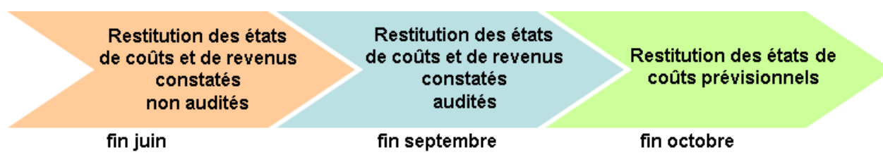
Figure 3. – Vision schématique du calendrier de restitution réglementaire

Le calendrier qui se détache est présenté ci-dessous sous forme de diagramme :